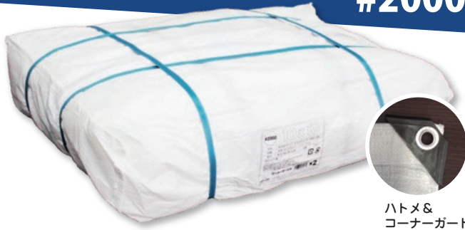
ハトメ&コーナーガード付