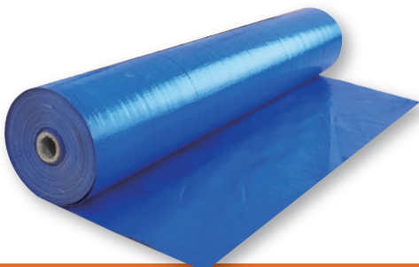
ブルーシート 原反