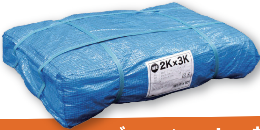
ブルーシート 軽量

建築現場などで周囲を囲って埃の飛散を防ぐ。資材の養生。風雨や汚れから守る。広げる、包む、敷く、被せる、様々なシーンにご使用いただけます。