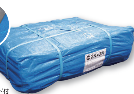
ブルーシート # 3000