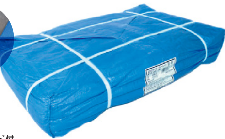
ブルーシート # 2000