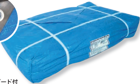
ブルーシート # 2000