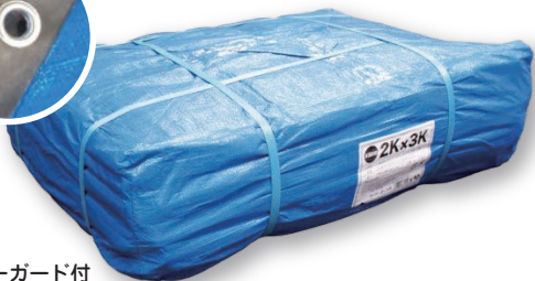
ブルーシート # 3000